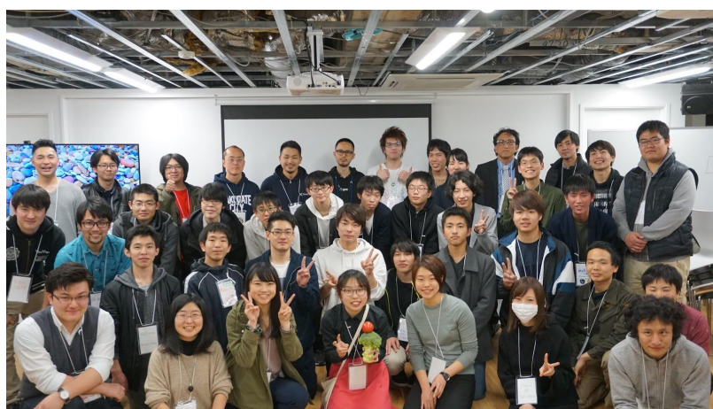
2019年3月高専生30人以上が参加した高専キャリア主催のアイデアソンの写真

「Curious Biz-con」は、起業や先進的な企業への就職を志す高専生が自分たちで考えたビジネスアイデアを競い合うビジネスコンテスト(ビジコン)です。見事に優勝を果たしたアイデアは、高専キャリアの新規事業として事業化される予定です。なおビジコンを含めた起業家育成イベント/キャリア教育セミナーは、来年の2020年には年間12回の開催を予定しています。